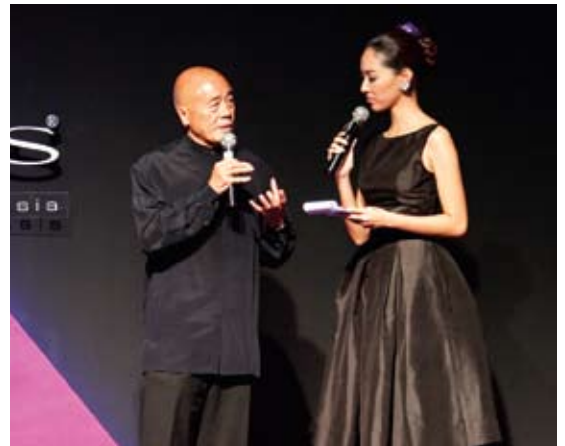
Ken Hom, Master chef of modern Asian cuisine