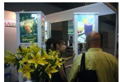
Food and Hotel VIETNAM 2009