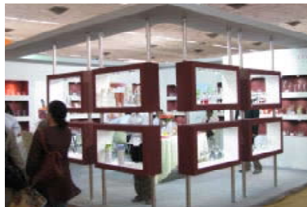
AAHAR THE INTERNATIONAL FOOD FAIR 2009 New Delhi