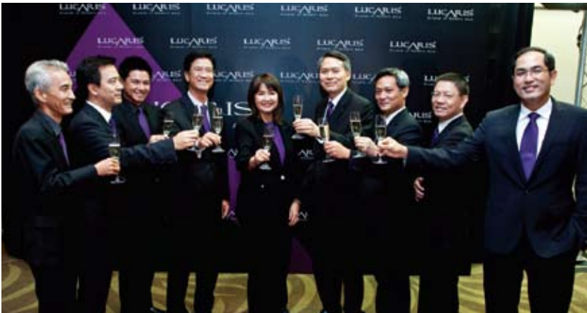
Ocean Glass's Board of Directors joined together to celebrate the brand launching "Lucaris-The Modern Asian Dining & Wining Experience" at Grand Ballroom, InterContinental Hotel, Bangkok.