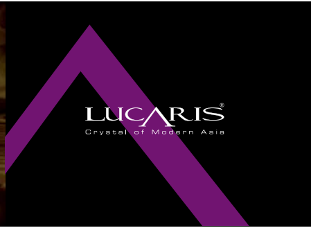
Crystal of Modern Asia