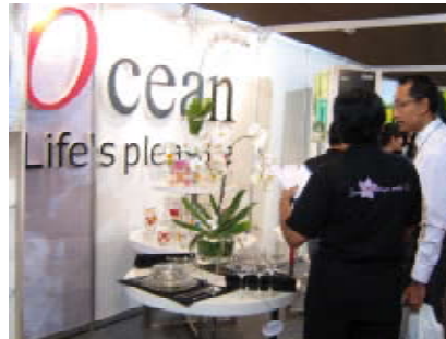
Food and Hotel Indonesia 2009