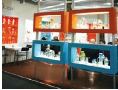
AMBIENTE Frankfurt 2009