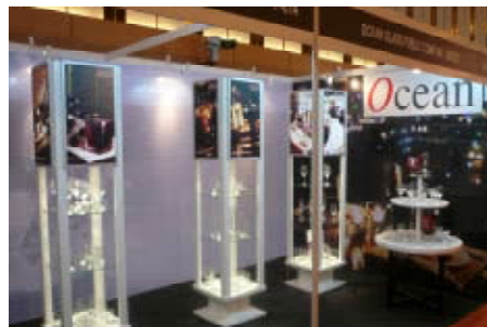
Food and Hotel Malaysia 2009