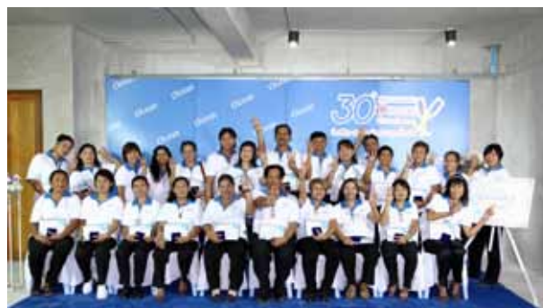
30 years Service and Retirement Award Ceremony