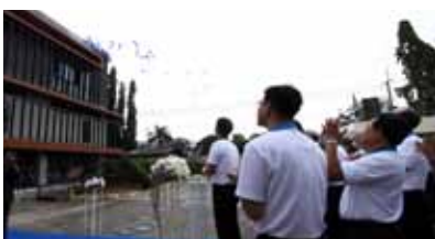
Opening Ceremony of "Tanyah Pociwong" Building at Ocean Glass Factory