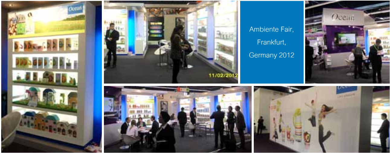
Ambiente Fair, Frankfurt, Germany 2012