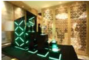
Introducing Lucaris 2012 New collection Hong Kong Hip at The Ritz-Carlton, Hong Kong